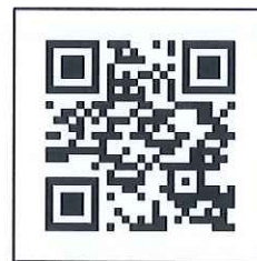
報名連結 QR Code