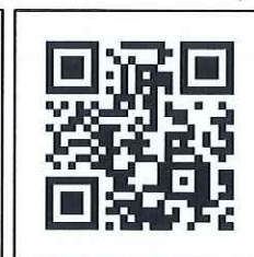
意見調查 QR Code