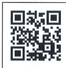
課程教材 QR Code