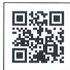
報名連結 QR Code